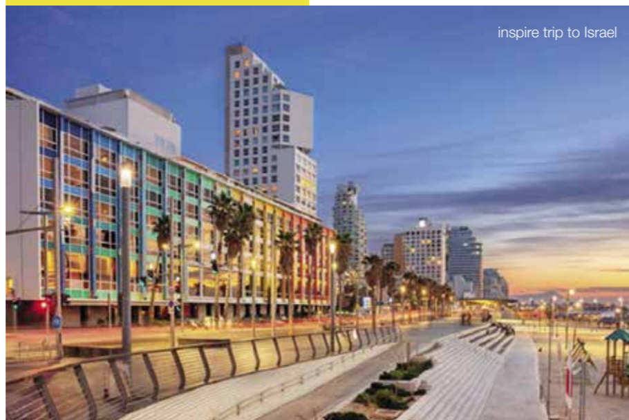
inspire trip to Israel