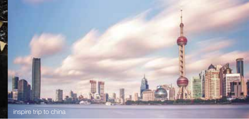
inspire trip to china